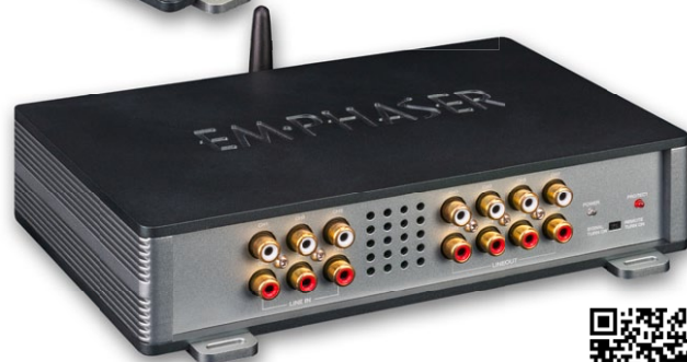
EA-D800 8-Kanal DSP-Verstärker mit BT-Audiostreaming