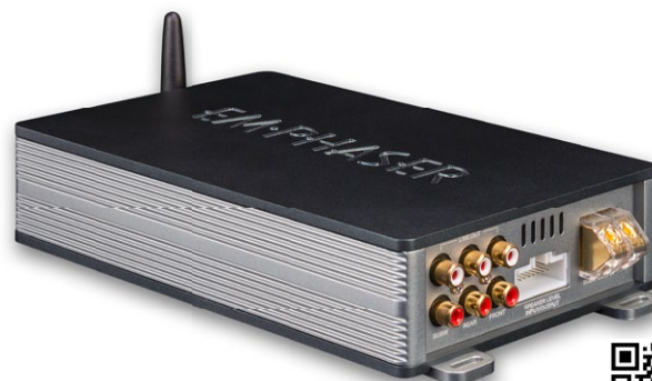
EA-D500 5-Kanal DSP-Verstärker mit BT-Audiostreaming