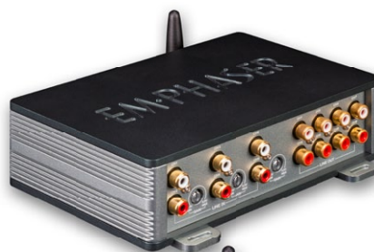
EA-D8 8-Kanal DSP mit BT-Audiostreaming